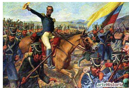
El Mariscal de Ayacucho, Imagen obtenida de: http://ismaelalejandromolina27.blogspot.com/

Para el sesquicentenario de la Campaña Libertadora se ejecutaron, entre otras, las siguientes obras: remodelación y embellecimiento de los monumentos de los campos del Puente de Boyacá y el Pantano de Vargas, en donde se levantó el imponente monumento escultórico del maestro Rodrigo Arenas Betancur, en homenaje a los 14 Lanceros; adquisición y remodelación de la Casa del Fundador de Tunja, Don Gonzalo Suárez Rendón; inauguración del Museo de Arte Colonial Religioso de Duitama; iniciación de la construcción de los estadios La Independencia de Tunja, Tundama de Duitama, El Sol de Sogamoso y el 9 de septiembre de Chiquinquirá; edición y reimpresión del Álbum de Boyacá del canónigo Cayo Leónidas Peñuela; construcción de la planta física de la Escuela Normal Superior “Leonor Álvarez Pinzón” de la ciudad de Tunja y construcción